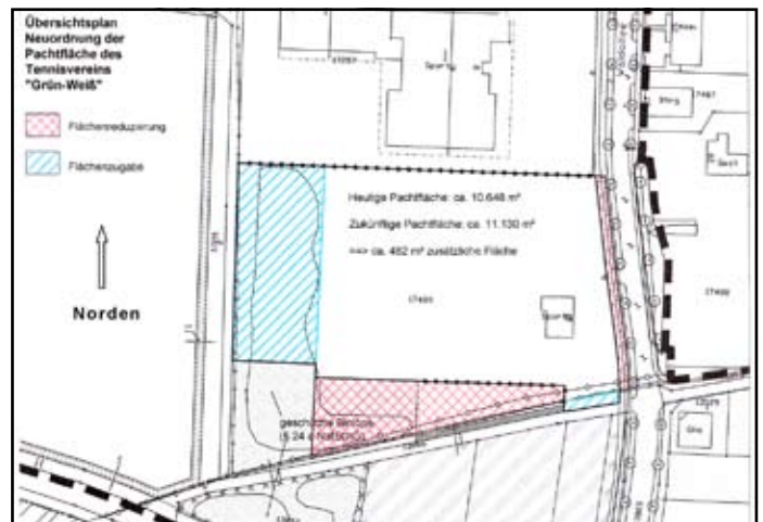
Westen, auf der zwei weitere Tennisplätze errichtet werden können, wenn Bedarf besteht.

Mit der Ansiedlung der „Zwei Burgen Bouler“ im Süden unserer Anlage im Jahr 2003 war ein Gelandetausch verbunden. Die rot schraffierte Fläche im Süden der Anlage wurde abgetreten und dafür erhielt der Verein die blau schraffierte Fläche im